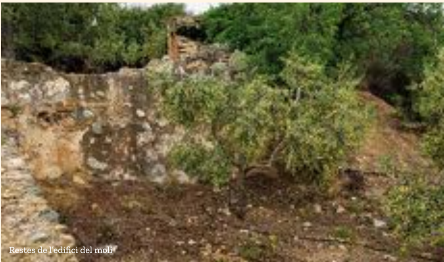
Restes de l'edifici del molí

Quan, de vegades, passem pel camp, podem veure restes de marges o edificacions, molts cops, irreconeixibles a primera vista. Però si ho mirem amb més atenció, ens poden donar pistes de què era allò que tenim davant. Si, a més, una vegada estudiem més sobre el terreny i haver arribat a alguna conclusió, ho podem corroborar amb referències històriques i fonts escrites podem tancar el cercle i confirmar, o no, les nostres suposicions.