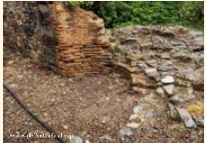
Restes de l'entrada al cup