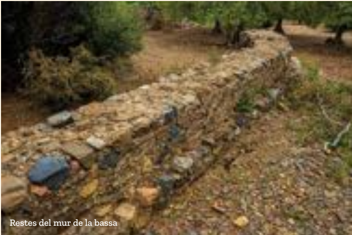
Restes del mur de la bassa